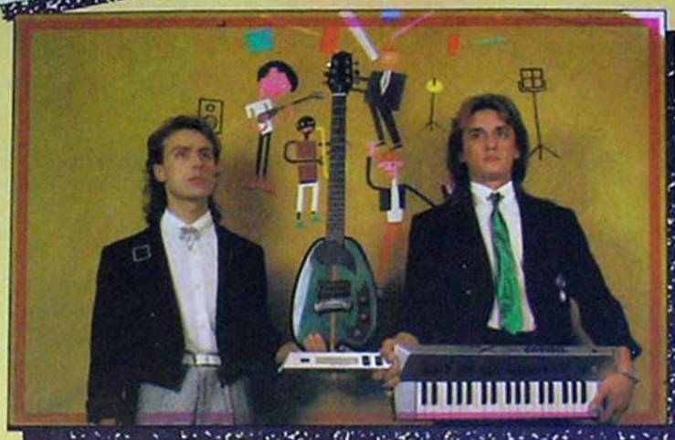
ДУЭТ ЭЛЕКТРОННОЙ МУЗЫКИ DUET OF ELECTRONIC MUSIC